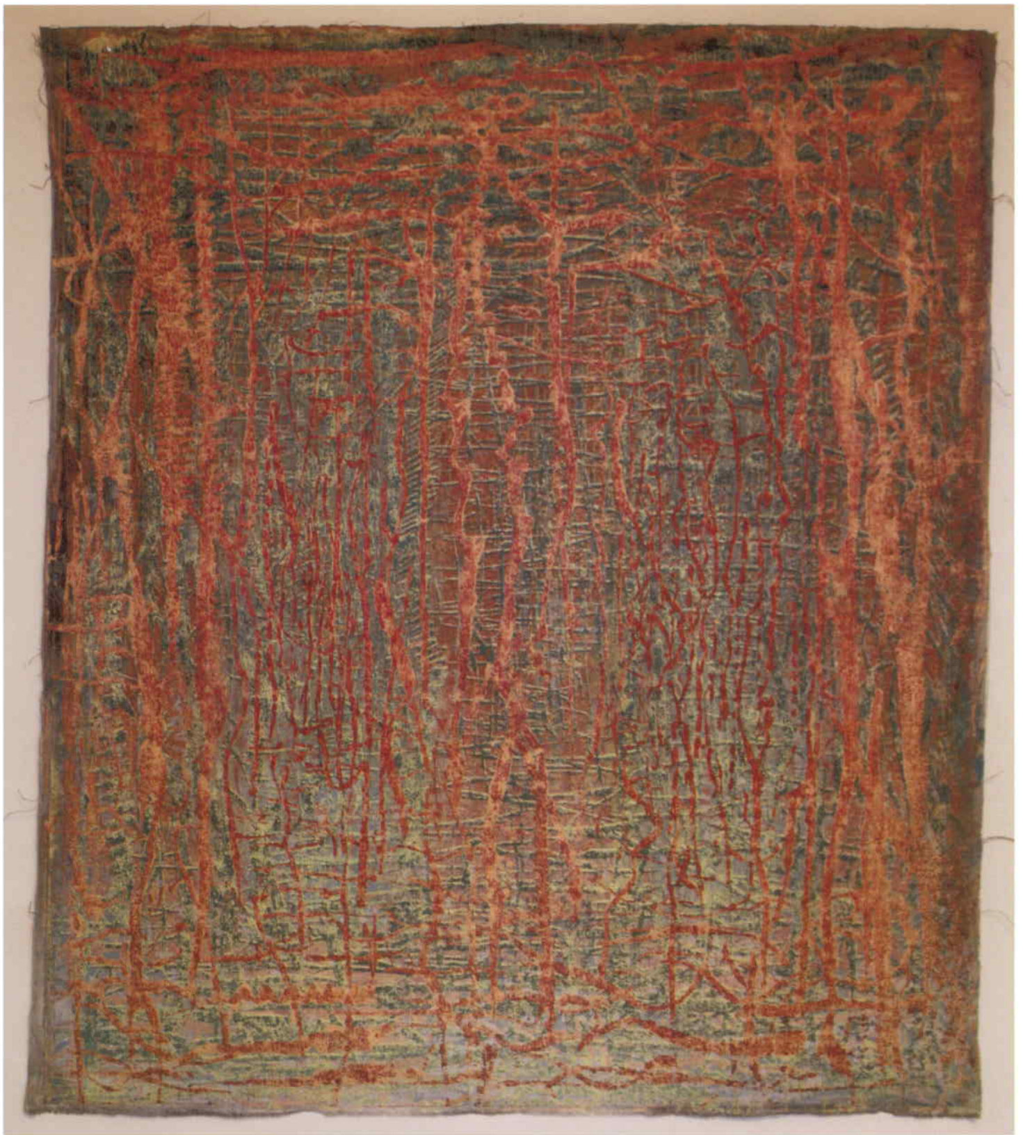
Vinice, 2012, kamenotisk na plátně, 100 x 85 cm