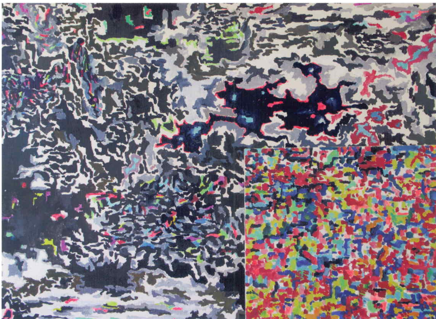
Černá krajina, Krajina I, 2008 – 2011, akryl, olej, plátno, výřez (Martin Čada)