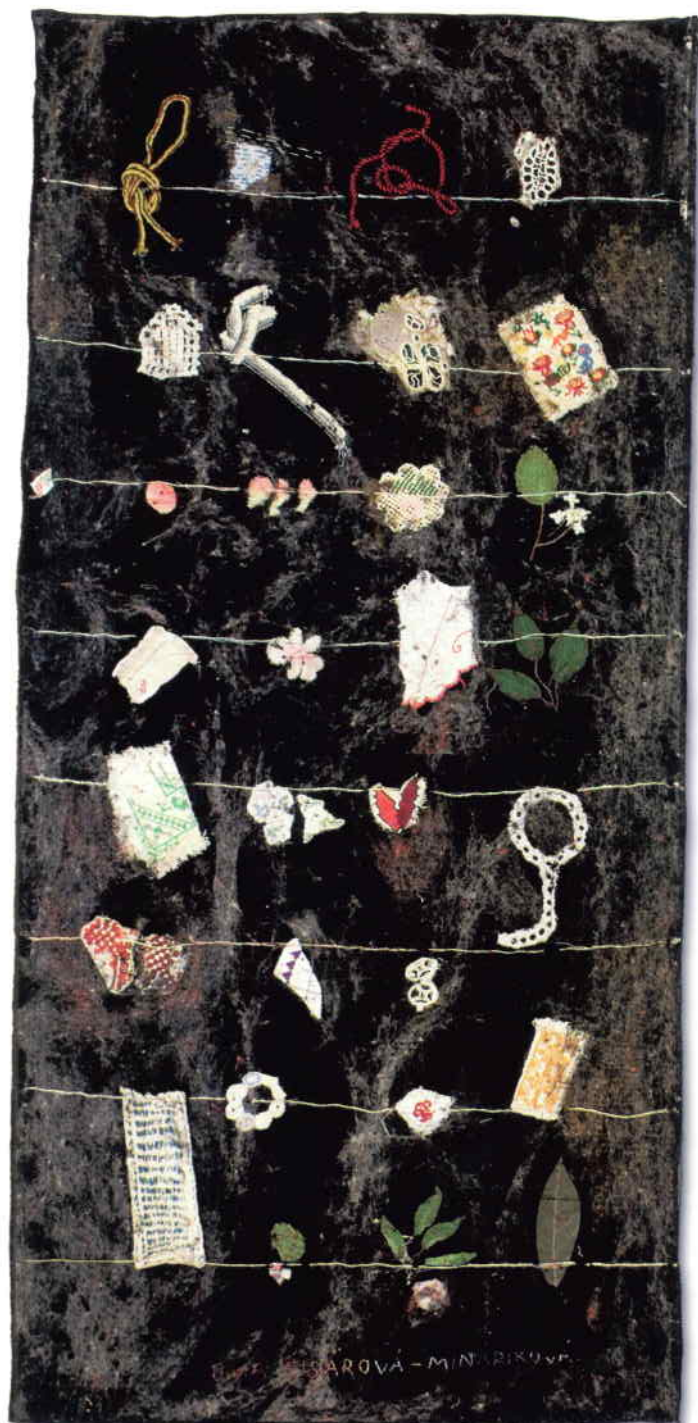
Kaligrafický zápisník III. A IV., 1997, textilná koláž, monogramy, ready mady (netkaný textil NETEX), splstená vlna, 135 x 60 cm