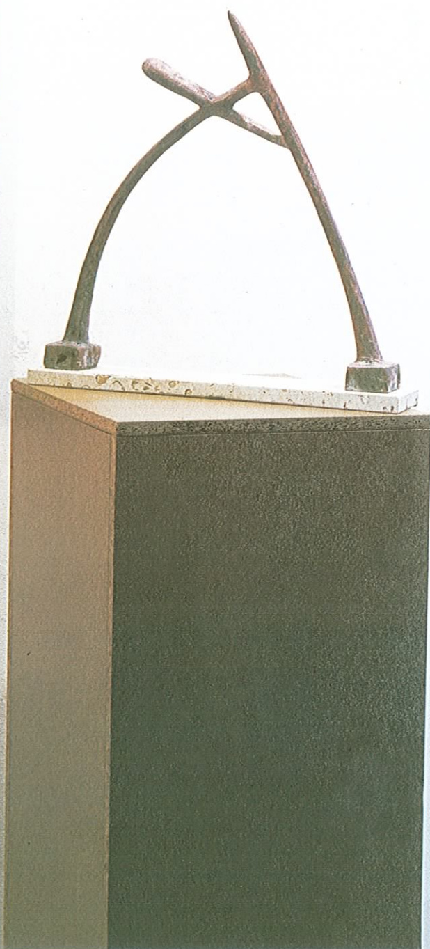
Pohled do společné instalace s obrazem I. Sedláčka a plastikou R. Hankeho