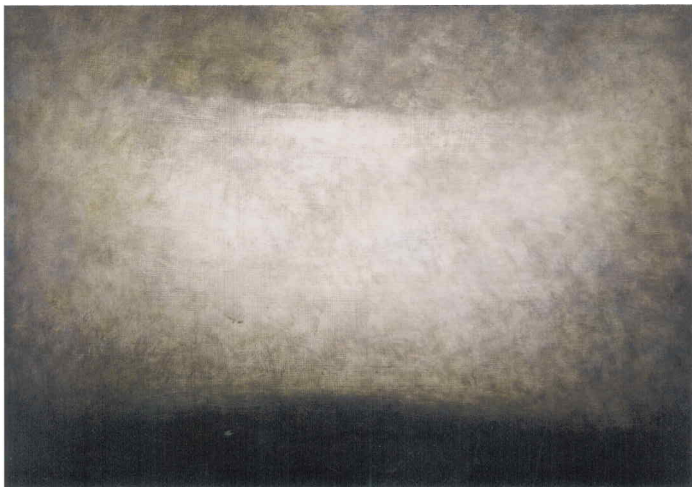
Návříší, 1997, olej na desce, 64 x 88 cm