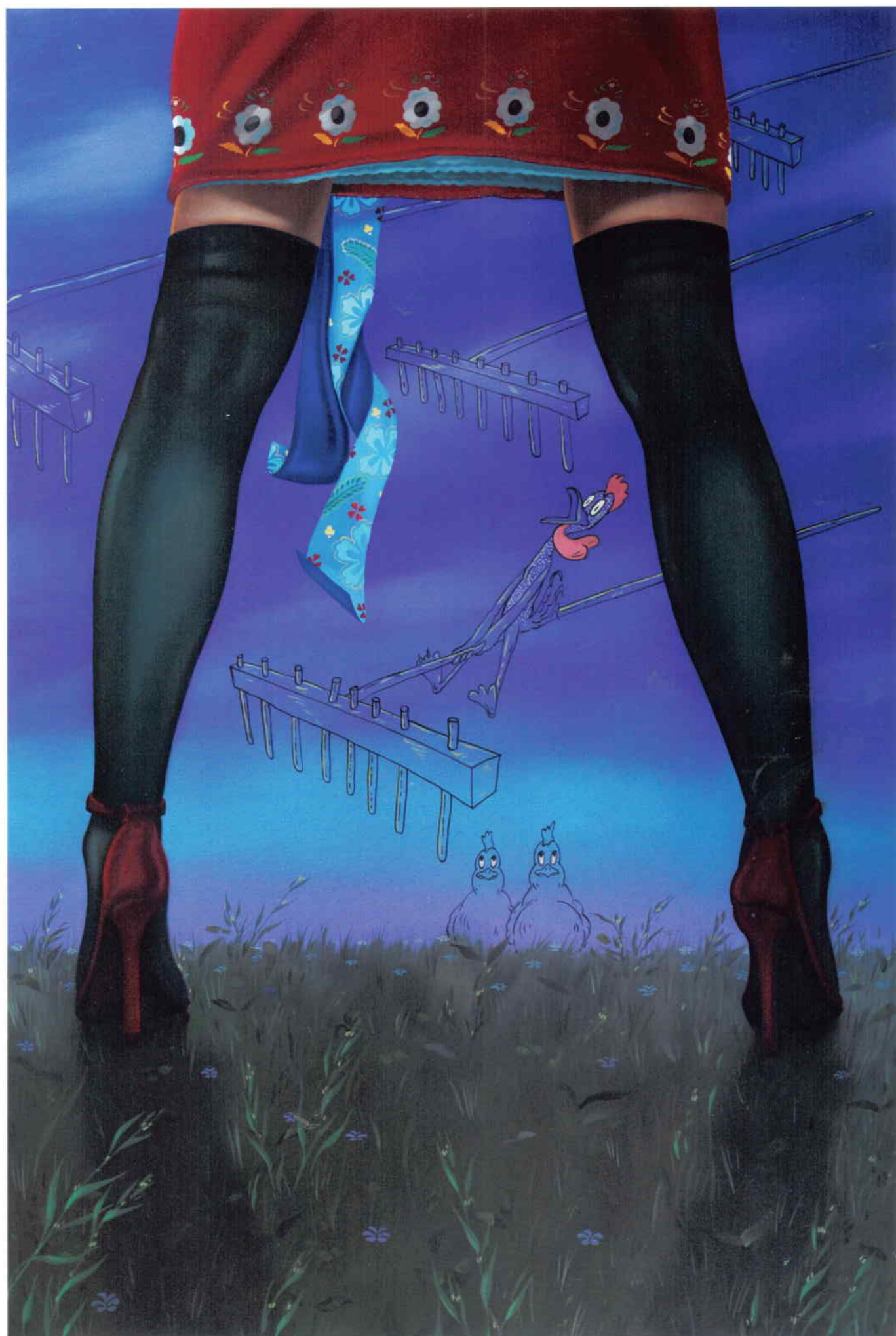
Na senách, 2010, olej na plátně, 140 x 94 cm