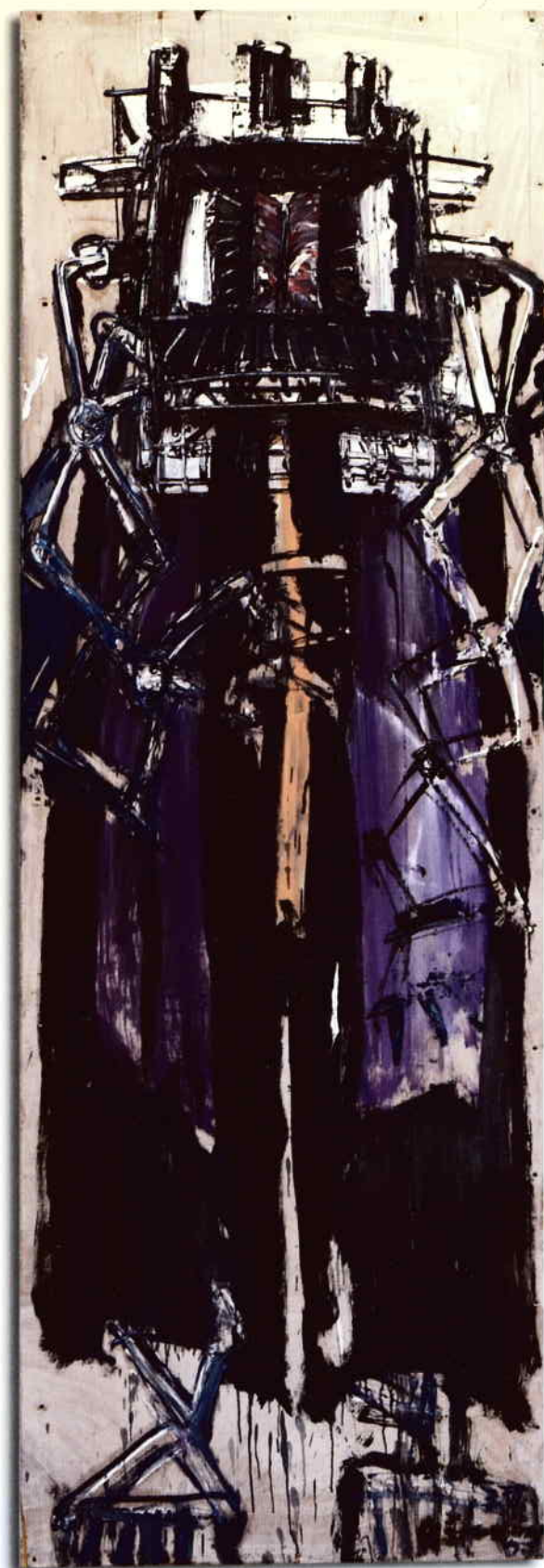
z cyklu České soudnictví (Kauza Mánes V a IV), 2007, olej na překližce, 185 x 75 cm a 178 x 61 cm