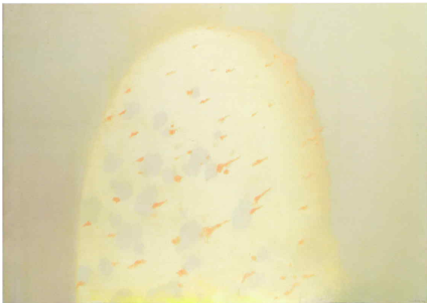
Záblesky, 2004, olej na plátně, 85 x 120cm