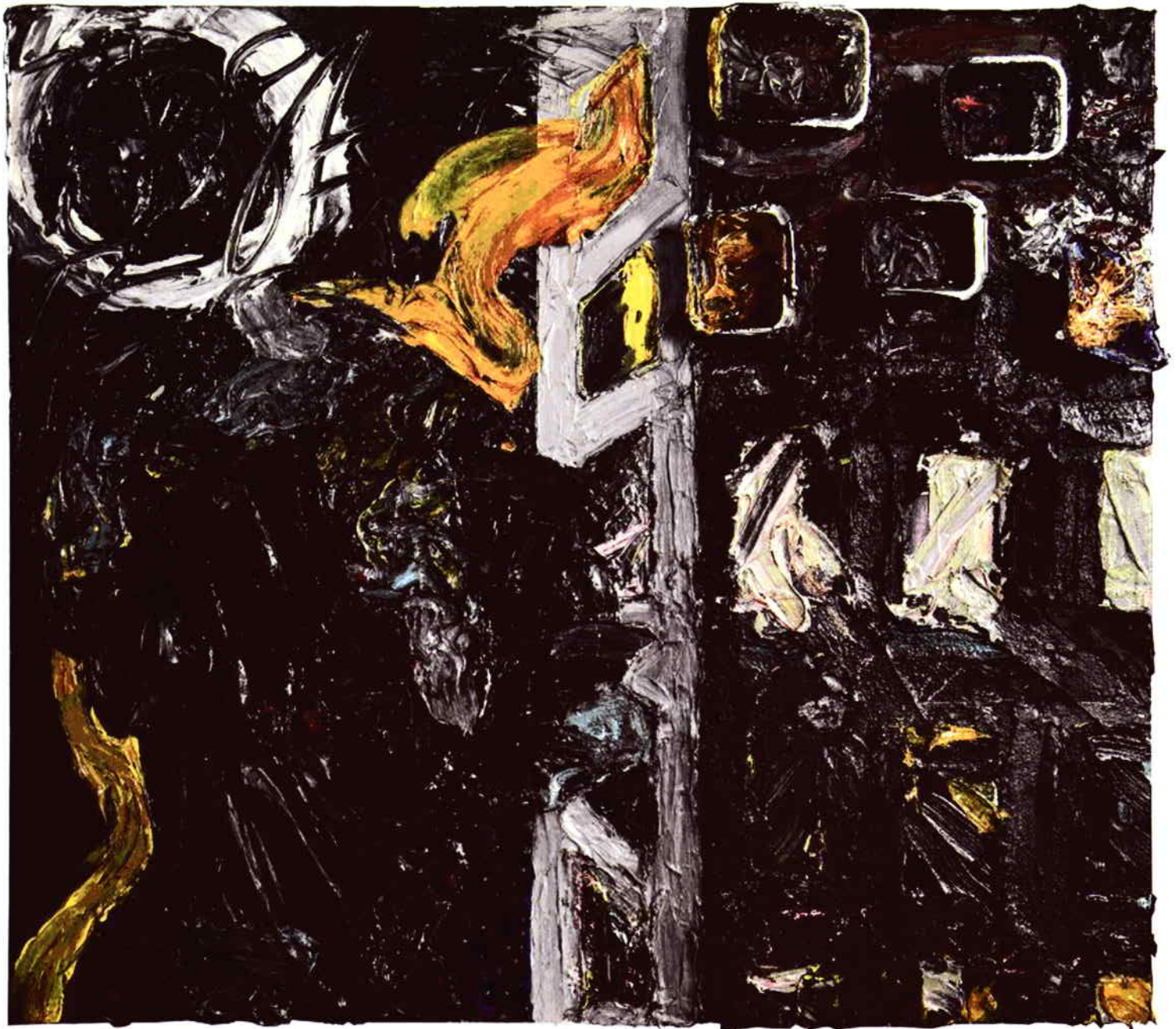
Posedlost, 2009, akryl na plátně a sololitu, 123 x 135 cm